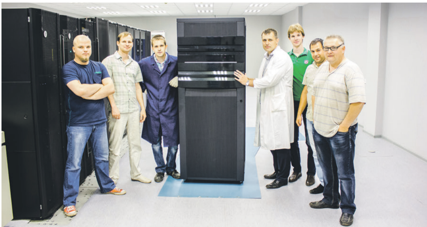
КОЛЛЕКТИВ КОРПОРАТИВНОГО ЦЕНТРА обработки данных

Коллектив отделения поздравляет всех работников отделения и службы ИТ и БП, а также ветеранов с этим знаменательным событием и приглашает всех принять участие в праздничных мероприятиях, которые пройдут в июле.