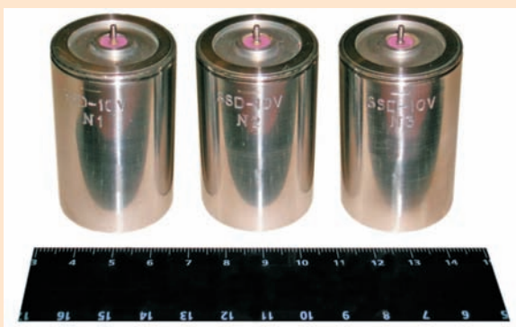
Батарей, изготовленные по контракту с General Atomics (США)